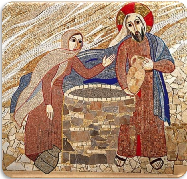
"Se tu conoscessi il dono di Dio..." (Gv 4,10) Gesù con la Samaritana - M. Rupnik